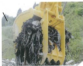
出展:(株)室戸鉄工所HPより